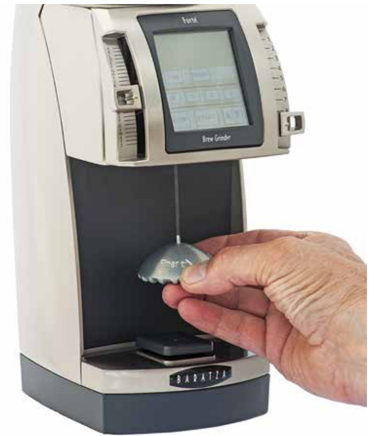
Gebruik het maalschijf kalibratie gereedschap als de molen draait.

hendels op de laagste stand, helemaal tot de bodem. Laat de molen lang genoeg draaien zodat er geen gemalen koffie meer achter is gebleven. Verwijder de opvangbak (Voor Vario-W en Forte , TARE op het apparaat). Druk nu op een van de voorkeurtoetsen, en daarna op START en steek het Kalibratie gereedschap in de 2mm inbusschroef (De molen draait tot dat u op STOP drukt ). Als de motor draait beweeg dan de Macro hendel helemaal omhoog (stand 1). U moet dan geen verandering in motorsnelheid moeten horen. Beweeg nu langzaam de Micro hendel naar het midden(stand M). Als de motor niet afremt, gebruikt u het kalibratie gereedschap om de kalibratieschroef in de fijnere richting te draaien (zoals aangeven op het gereedschap) totdat de motor afremt. Deze instelling maakt het mogelijk alle malingen te maken. Als u een grovere maling wenst, draai dan het gereedschap in de tegenovergestelde richting van de pijl op het gereedschap.