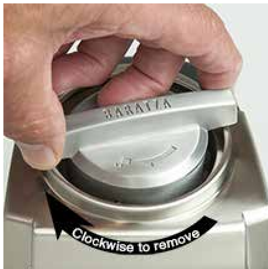
Draai maalsteen klokgewijs om te verwijderen

Was de opvangbak, vultrechter, en de trechterdeksel in warm water en zeep,