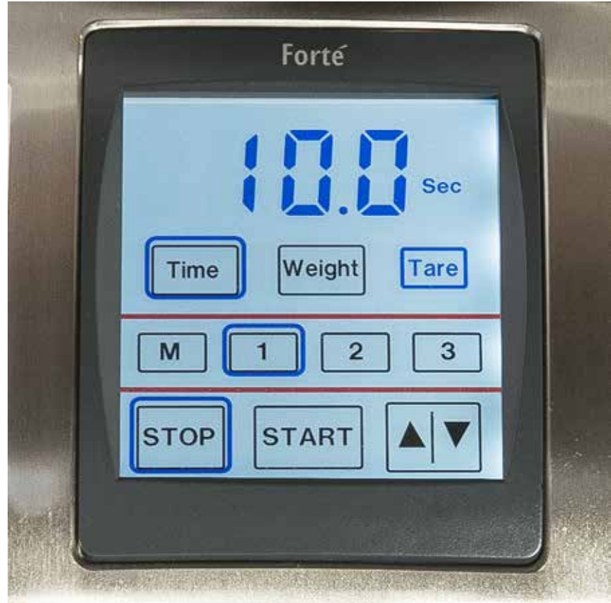
صورة اللوحة الامامية

ستعرض الشاشة اثناء عملية الطحن وقت الطحن ووزن القهوة في العلبة, وعندما يصل الوزن إلى ذلك الذي تم برمجته (0,2/+ جرام) سيتوقف الموتور وستظهر الشاشة الوزن الحقيقي في العلبة وذلك لمدة ثلاثة ثواني, ثم تعيد الشاشة برمجة الوزن المبرمج. تسمح الطاحونة فقط بطحن ما يصل إلى 120 جرام في المرة الواحدة, ويمكنك إيقاف الوحدة أثناء الطحن, وذلك بالضغط على زر التشغيل/إيقاف (START/STOP), سيتوقف الموتور وتعيد الشاشة الوزن الذي تم اختياره سابقا.