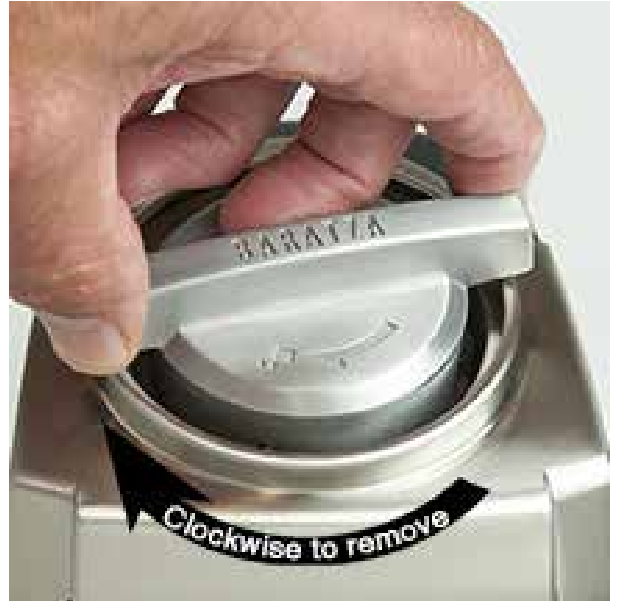
لف الغلاف عكس عقارب الساعة للإزالة

الجيد الطاحونة من تقديم طحن جيد, ويعمل التنظيف أيضاً على إزالة البعض من زيوت القهوة, وهذه بإمكانها أن تضعف وتفسد طعم القهوة.