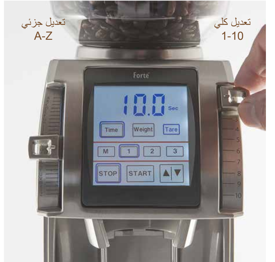
الصورة توضح التعديل الجزئي والكلي

وقم بعد ذلك بالضغط على زر التشغيل (START). قم بالضغط على زر الإيقاف بعد الوصول إلى 5 غرام من القهوة التي تم طحنها, ثم افحص حجم الجسيمات, فإذا كان حجم الجسيم قريباً من رغبتك, استخدم الرافعة الجزئية لتثبيت حجم الطحن, أما إذا كان حجم الجسيمات يحتاج إلى تعديل, عليك ضبط الرافعة الكلية على وضع جديد. إن المجال الكامل على ميزان صغير يتساوى مع "ضغطة واحدة" أو تغيير الوضع على المستوى الكلي. يؤدي ضبط الرافعة على المستوى الأعلى إلى إنتاج احجام جسيمات أصغر, أما ضبطها على المستوى المنخفض فيؤدي إلى إنتاج جسيمات أكبر.