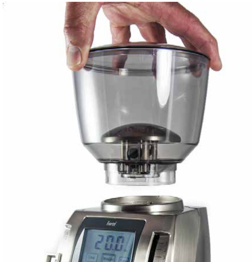
Hand platziert den Trichter auf das Gehäuse.

Die VARIO-W Mühle auf eine ebene Fläche stellen. Den Trichter mit dem befestigten Deckel auf das Mühlengehäuse setzen. Die beiden kleinen Laschen an der Unterseite des Trichters müssen mit den zwei Kerben am Rand auf der Oberseite der Mühle übereinstimmen. Der Verschluss sollte an der Rückseite der Mühle ausgerichtet sein.