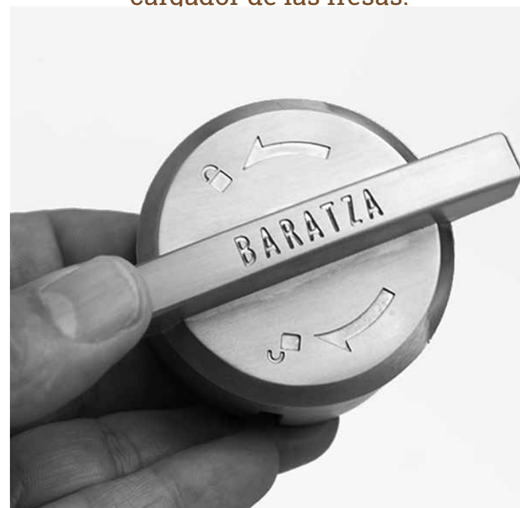
Gire el cargador de las fresas en el sentido contrario a las agujas del reloj para asegurarlo.