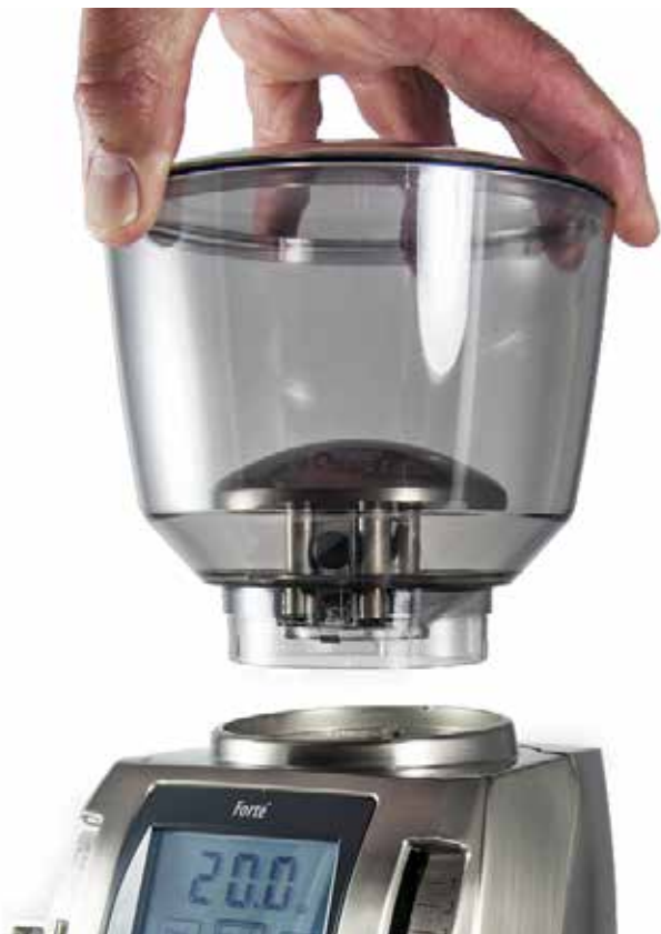
Afbeelding van hand die de molen op behuizing plaatst

Plaats de VARIO-W koffiemolen op een vlakke ondergrond. Zet het deksel van de vultrechter op zijn plaats, zet de trechter op de behuizing van de molen door de twee kleine lipjes aan de onderkant van de trechter in de twee sleufjes in de rand aan de bovenzijde van de molen te laten zakken. De Open/Gesloten hendel kunt u aan de achterkant van de molen vinden.