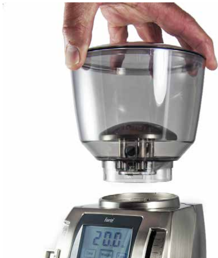
Изображение руки, помещающей загрузочную воронку в корпус

Поместите кофемолку VARIO-W на ровную поверхность. Вставьте бункер в кофемолку, чтобы два выступа в горлышке бункера вошли в пазы корпуса. Накройте бункер крышкой. Рычаг Открытия/Закрытия должен быть ориентирован на заднюю часть кофемолки.