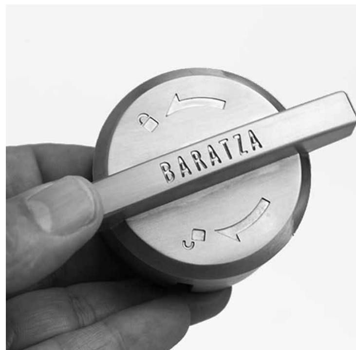
Rotate burr carrier counter clockwise to lock in place.