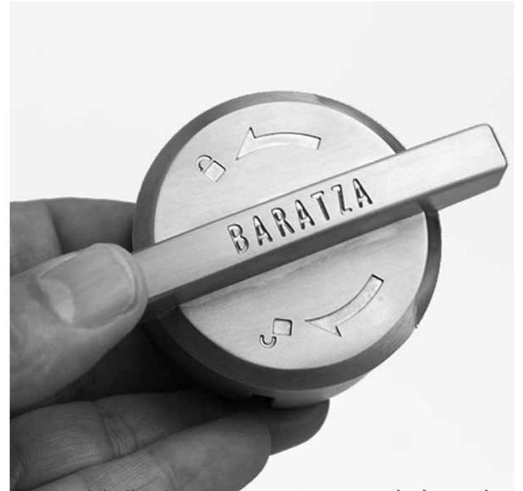
لف حامل الغلاف في عكس اتجاه الساعة وذلك لغلقها في المكان المحدد.