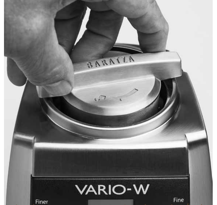
لف أداة الغلاف الخاصة ببراتزا في اتجاه عقارب الساعة وذلك لإزالة حامل الغلاف.

إذا كانت الطاحونة تُستخدم بصفة يومية, لا بد من تنظيف الغلاف (سواء أكان فولاذي أو من السيراميك) على الأقل مرة كل عدة أشهر, وذلك باستخدام أقراص (انظر