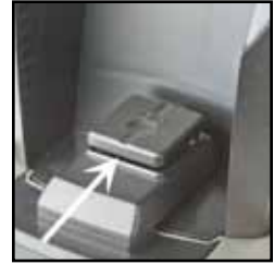
Bild #10 Die Ritze unter der Wiegeplattform MUSS frei von gemahlenem Kaffee sein.

Sollte die Gewicht-Anzeige beim Kaffeemahlen nicht richtig zählen, entfernen Sie den Mahlgutbehälter und blasen Sie Luft unter der Wiegeplattform um etwaigen gemahlene Kaffee aus der Ritze unter der Plattform zu entfernen. Verwenden Sie KEINE Hilfsmittel unter der Wiegeplattform. (siehe Bild Nr. 10)