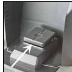
Photo #10 L'espace étroit se trouvant sous la plate-forme de pesée DOIT être libre de tout café moulu.

Si le poids affiché ne se compte pas correctement lorsque vous moulez le café, retirez le réceptacle à mouture et soufflez de l'air sous la plate-forme de pesée pour nettoyer toute mouture de café se trouvant dans l'espace étroit sous la plate-forme. N'utilisez AUCUN type d'outil sous la plate-forme de pesée (voir photo #10).